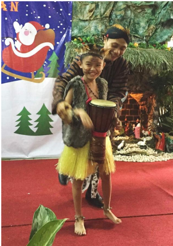
Weihnachtsfeier bei Tri Asih...