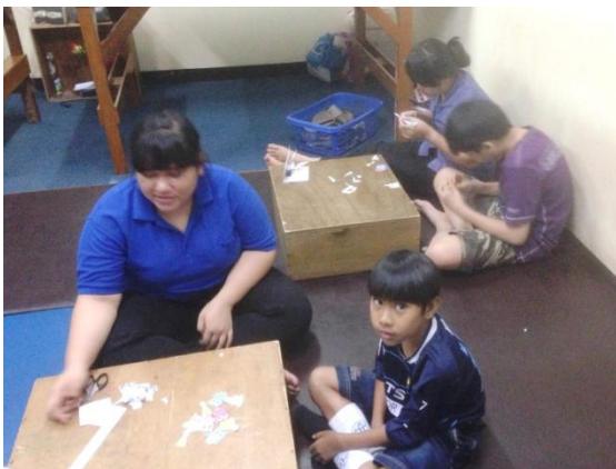
Kinder beim Basteln: Therapie zur Förderung der Feinmotorik und Konzentration

Tri Asih I in Kampung Duri beherbergt eine Grundschule, die gemeinsam von der Yayasan Tri Asih und DIE BRÜCKE im Jahre 1988 errichtet wurde. Die derzeit 56 Kinder in der Grundschule Tri Asih I werden in ihrer Entwicklung zur Selbständigkeit gefördert, sie erwerben alltägliche Fertigkeiten wie z. B. die Durchführung von Hygiene, Arbeiten im Haushalt, Kochen und Nähen. Im Schulhaus befindet sich eine eigens dafür eingerichtete Übungsküche inklusive Wohnraum. Einige der Kinder erlernen daneben auch das Handarbeiten und die Herstellung verkäuflicher Gegenstände. Die Weiterentwicklung ihrer Motorik und Sprache wird durch die Anwendung von Therapien vor Ort unterstützt.