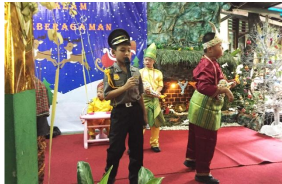
Die „Tri Asih Rock-Band“